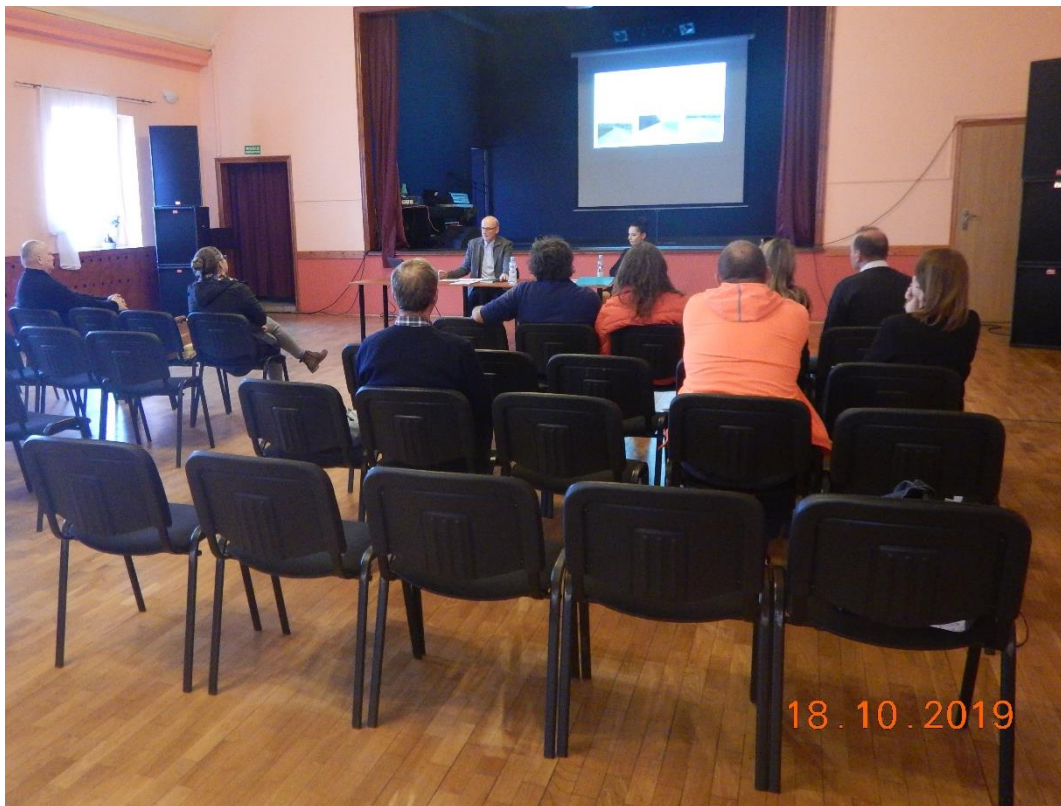
Photo 2 Information meeting for the EMP Annexe draft under 2A.1/1 held in MGOK in Międzylesie.