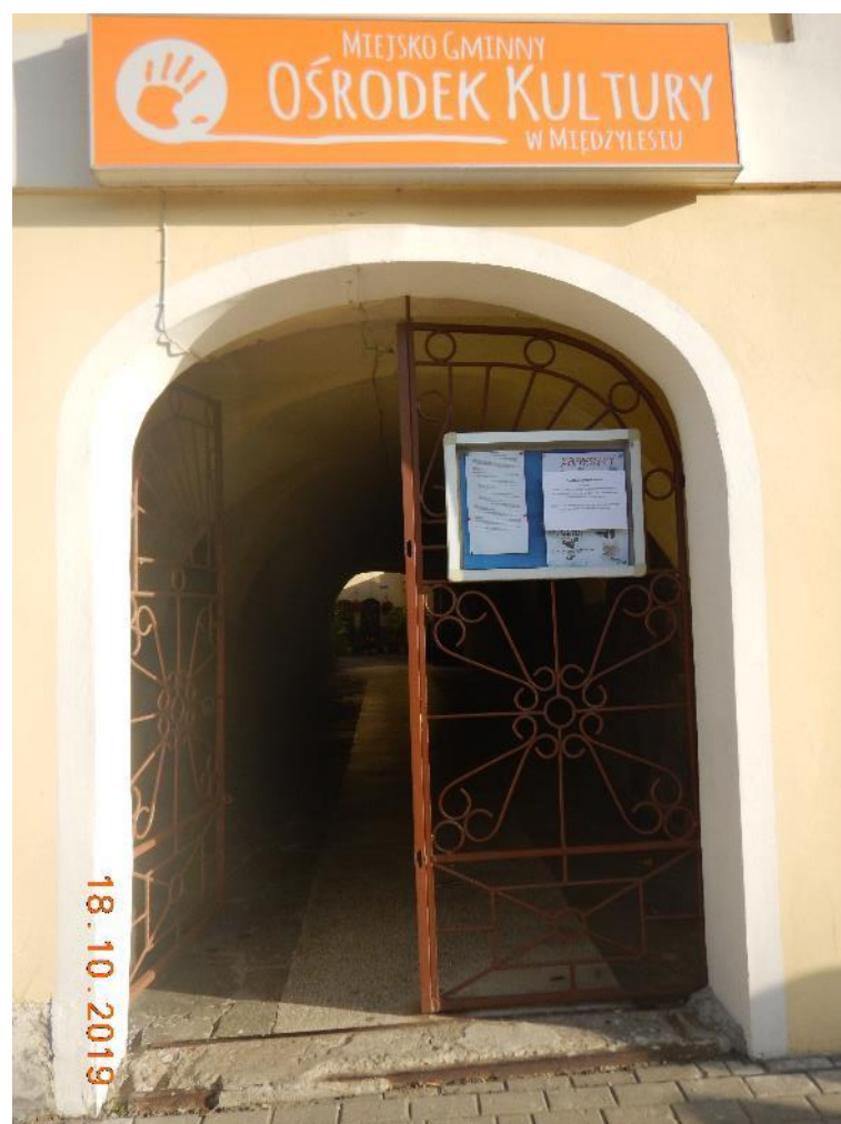
Photo 4 Information meeting for the EMP Annexe draft under 2A.1/1 held in MGOK in Międzyzlesie - notice at the entrance to MGOK.