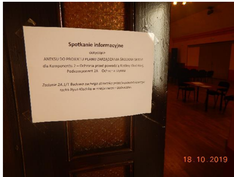
Photo 3 Information meeting for the EMP Annexe draft under 2A.1/1 held in MGOK in Międzyzlesie - notice on the entrance door to the hall.