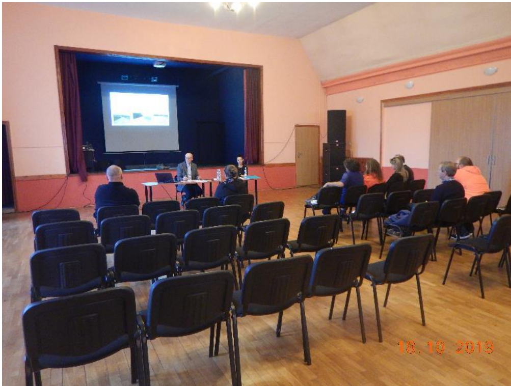
Photo 1 Information meeting for the EMP Annexe draft under 2A.1/1 held in MGOK in Międzylesie.