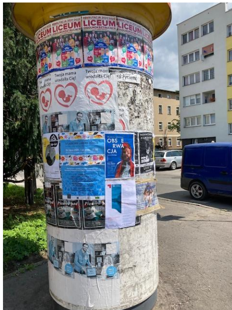
Fot. 10 Plakat informacyjny dot. konsultacji społecznych projektu PZŚ dla Kontraktu 2B.2/1 wywieszony na tablicy ogłoszeń w Łądku-Zdroju przy ul. Ogrodowej.