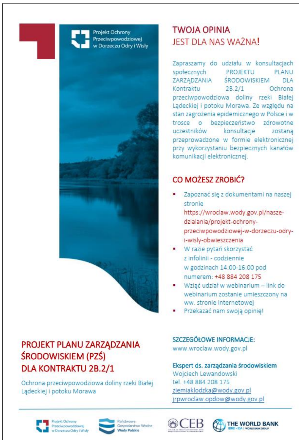
Ryc. 8 Plakat informacyjny zapraszający do udziału w konsultacjach społecznych dot. projektu PZŚ dla Kontraktu 2B.2/1.