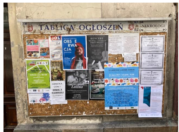
Fot. 8 Plakat informacyjny dot. konsultacji społecznych projektu PZŚ dla Kontraktu 2B.2/1 wywieszony na tablicy ogłoszeń w Łądku-Zdroju przy ul. Rynek.