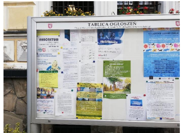
Fot. 7 Plakat informacyjny oraz obwieszczenie dot. konsultacji społecznych projektu PZŚ dla Kontraktu 2B.2/1 wywieszzone na tablicy ogłoszeń w Urzędzie Miasta i Gminy w Łądku-Zdroju.