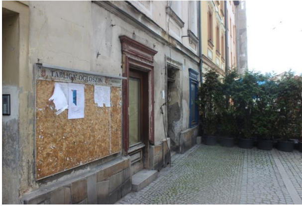
Fot. 9 Plakat informacyjny dot. konsultacji społecznych projektu PZŚ dla Kontraktu 2B.2/1 wywieszony na tablicy ogłoszeń w Łądku-Zdroju przy ul. Zdrojowej.