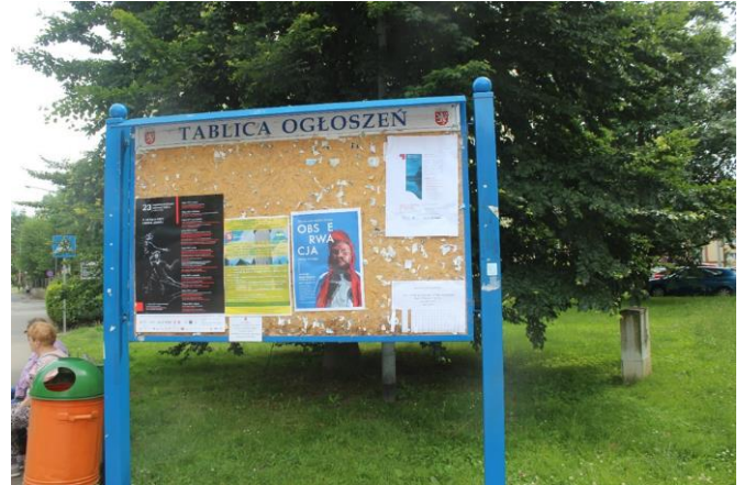
Fot. 11 Plakat informacyjny dot. konsultacji społecznych projektu PZŚ dla Kontraktu 2B.2/1 wywieszony na tablicy ogłoszeń w Łądku-Zdroju przy ul. Kościuszki.