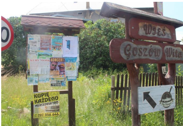
Fot. 6 Plakat informacyjny oraz obwieszczenie dot. konsultacji społecznych projektu PZŚ dla Kontraktu 2B.2/1 wywieszzone na tablicy ogłoszeń we wsi Goszów.