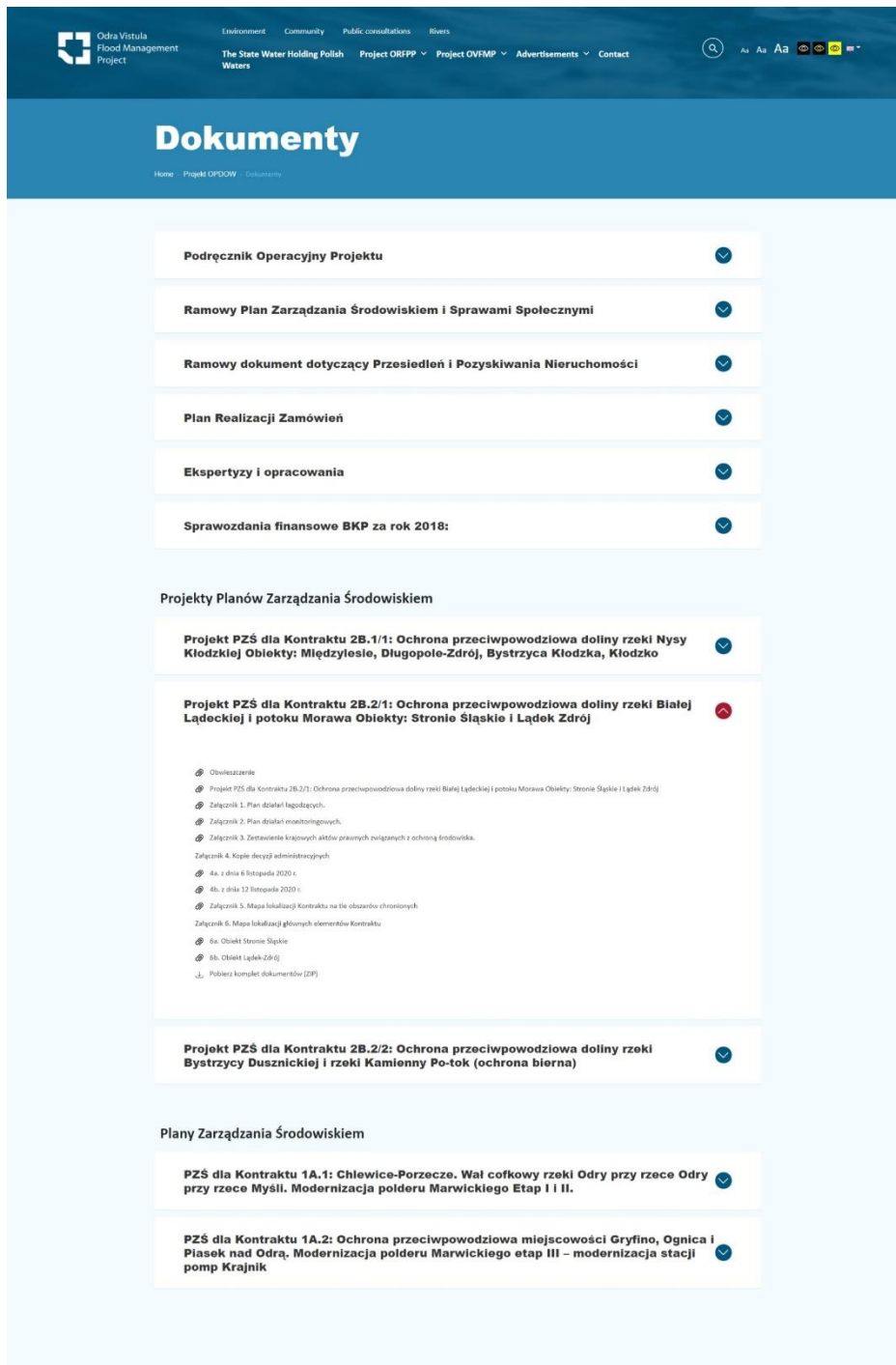
Ryc. 2 Obwieszczenie dotyczące konsultacji społecznych projektu PZS dla Kontraktu 2B.2/1 wraz z materiałami do pobrania, umieszczone na stronie internetowej BKP POPDOW.