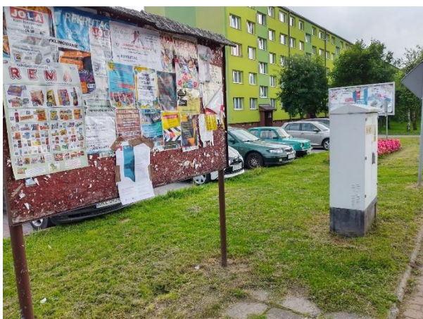
Fot. 2 Plakat informacyjny dot. konsultacji społecznych projektu PZŚ dla Kontraktu 2B.2/1 wywieszony na tablicy ogłoszeń w Stroniu Śląskim przy skrzyżowaniu ulic Nadbrzeżnej/Zielonej.