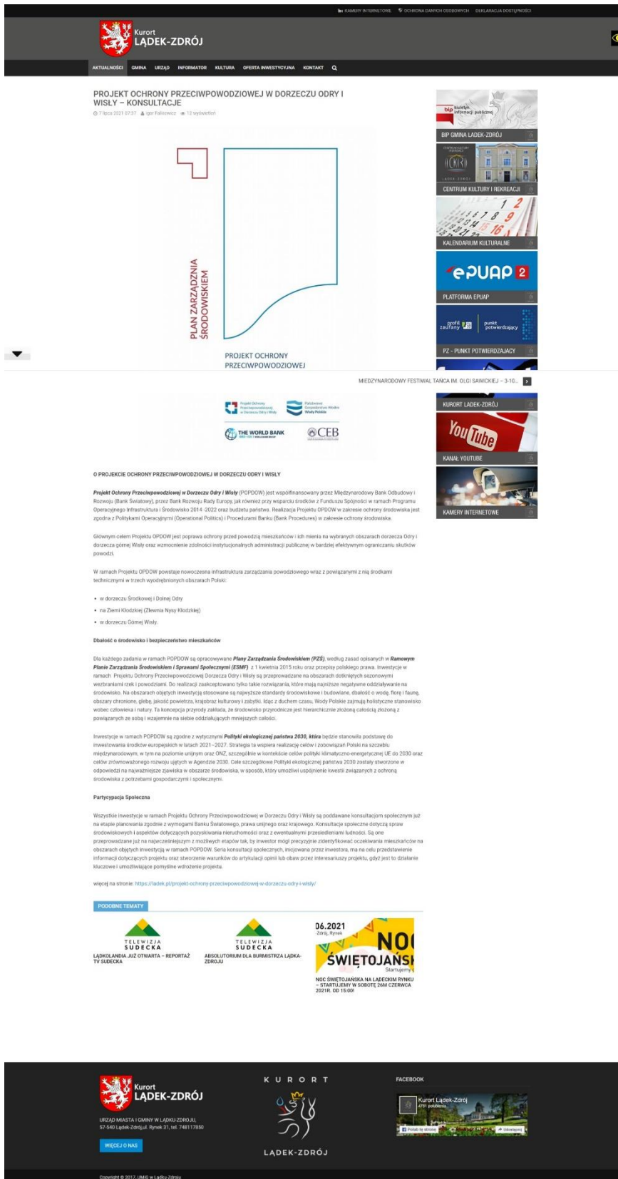
Ryc. 5 Obwieszczenie dotyczące konsultacji społecznych projektu PZŚ dla Kontraktu 2B.2/1 wraz z materiałami do pobrania, umieszczone na stronie internetowej Urzędu Miasta i Gminy Łądek-Zdrój.