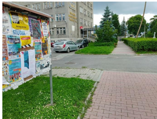
Fot. 3 Plakat informacyjny dot. konsultacji społecznych projektu PZŚ dla Kontraktu 2B.2/1 wywieszony na tablicy ogłoszeń w Stroniu Śląskim przy ul. Hutniczej.