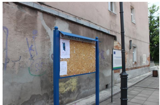
Fot. 12 Plakat informacyjny dot. konsultacji społecznych projektu PZŚ dla Kontraktu 2B.2/1 wywieszony na tablicy ogłoszeń w Łądku-Zdroju przy ul. Słodowej.