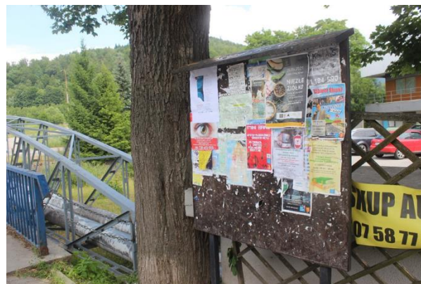
Fot. 4 Plakat informacyjny dot. konsultacji społecznych projektu PZŚ dla Kontraktu 2B.2/1 wywieszony na tablicy ogłoszeń w Stroniu Śląskim przy ul. Nadbrzeżnej.