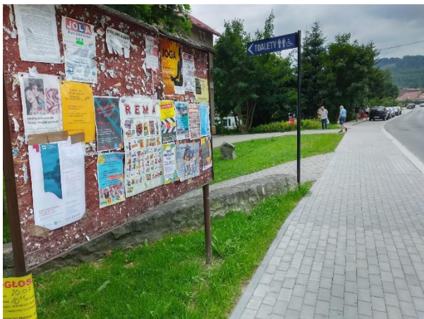
Fot. 1 Plakat informacyjny dot. konsultacji społecznych projektu PZŚ dla Kontraktu 2B.2/1 wywieszony na tablicy ogłoszeń w Stroniu Śląskim przy ul. Kościuszki koło budynku Poczty Polskiej.