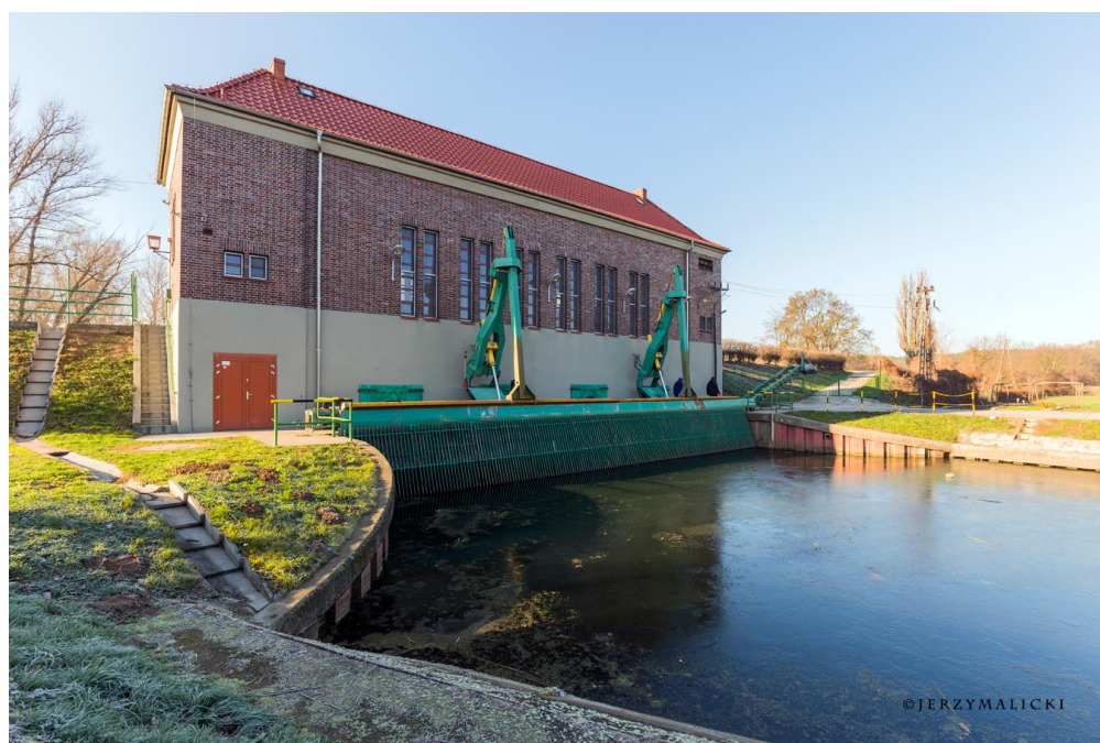
Budynek przepompowni Sadowa.

Dzięki funkcjonowaniu pompowni możliwe jest zapobieganie lokalnym podtopieniom oraz powodziom w okresie podwyższonych stanów wód rzeki Odry, kiedy grawitacyjny spływ wód jest niemożliwy. Przy wysokich stanach rzeki Odry, aby zapobiec tak zwanej "cofca" czyli cofaniu się wód z rzeki głównej do cieków dopływowych, śluza wałowa jest zamykana a agregaty pompowe są włączane. Chroniony teren o powierzchni ok. 200 km 2 stanowią użytki rolne oraz tereny zabudowane.