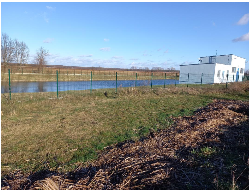
Przepompownia Tarnowa Łąka.

W 2011 roku pompownia została gruntownie zmodernizowana. Inwestycja obejmowała wymianę czterech przestarzałych pomp wałowych na nowoczesny sprzęt wraz z instalacją nowego systemu automatyki i sterowania. Wyremontowano również konstrukcję naziemną i podziemną budynku.