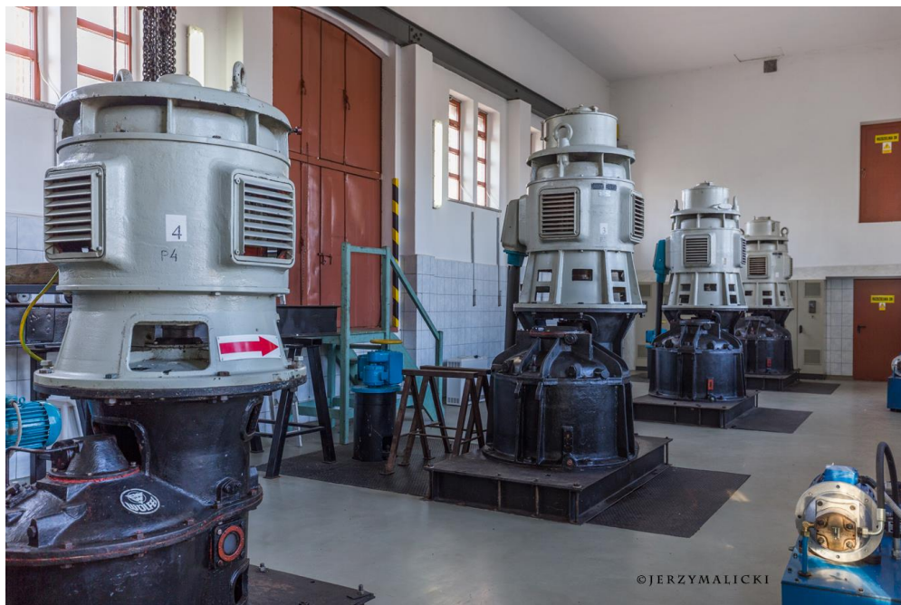
Stacja pomp Sadowa.