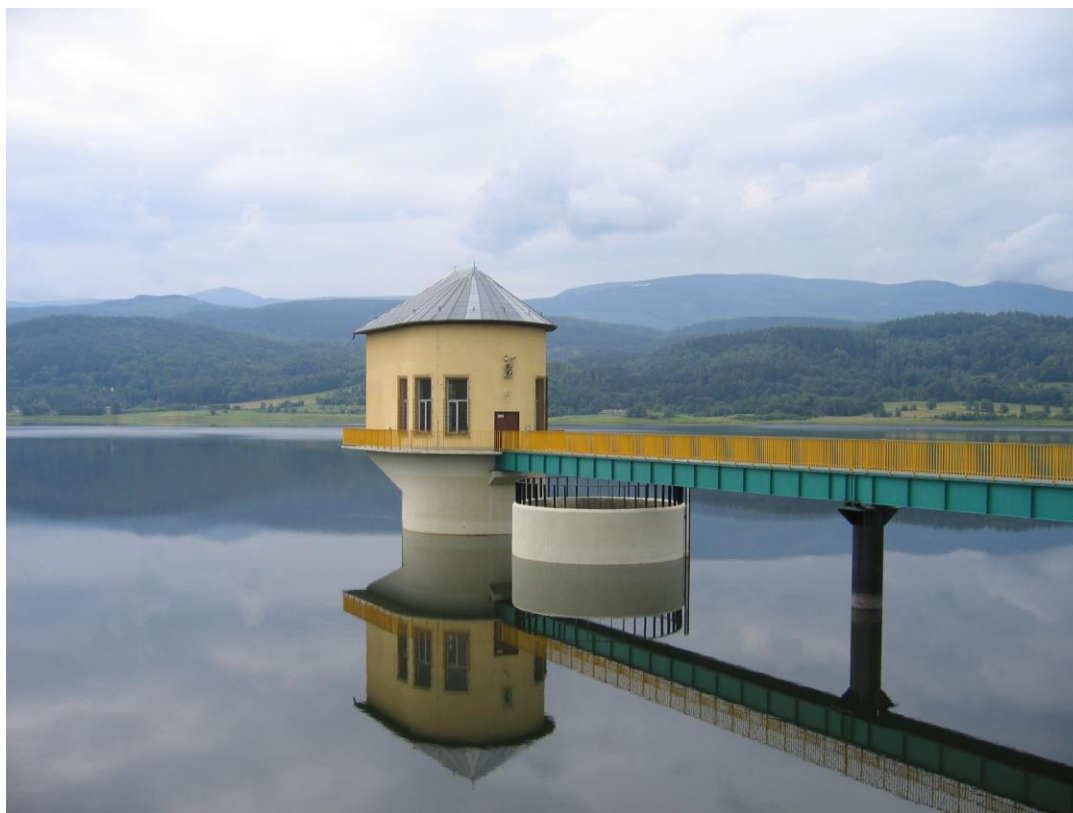
Zbiornik retencyjny Sosnówka na tle Karkonoszy.

Ze względu na strategiczną wartość zbiornika retencyjnego, który jest jednocześnie ujęciem wody pitnej dla miejscowej ludności, zalew w chwili obecnej nie jest udostępniony turystom w celach rekreacyjnych.