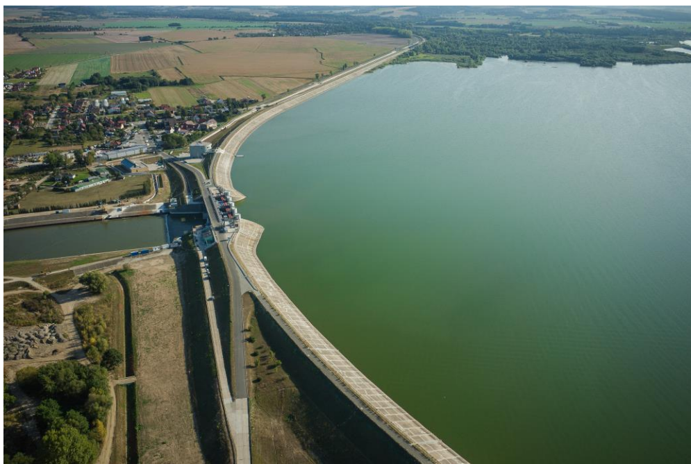
Pojemność całkowita zbiornika to 122,1 miliona metrów 3 .

Nad brzegami zbiornika występuje wiele gatunków ptaków, a wody jeziora są bogate w wiele gatunków ryb, takich jak sandacz, szczupak, okoń i leszcz.