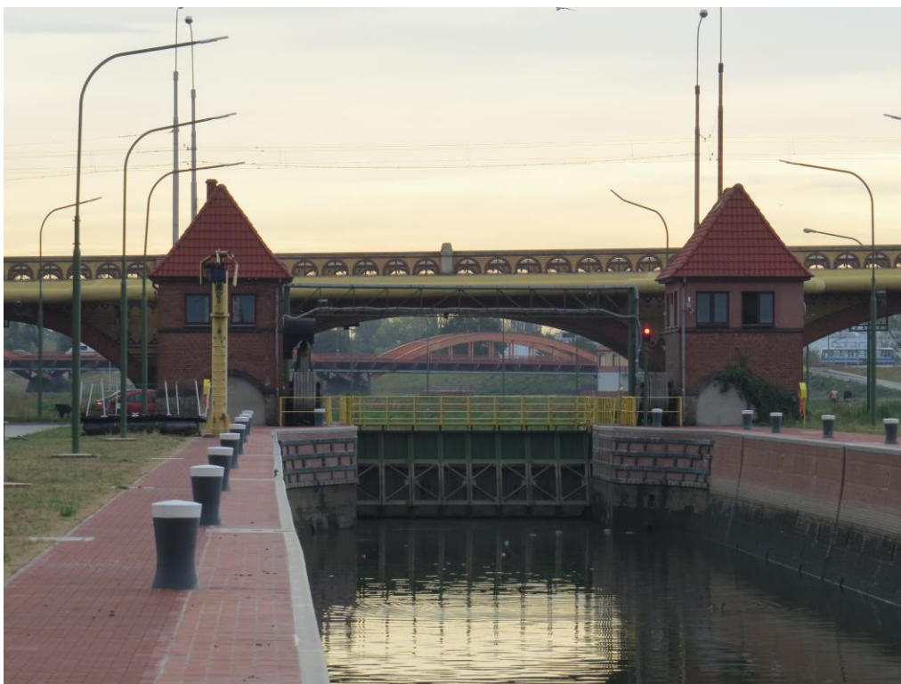
Głowa górna śluzy Różanka i bliźniacze budynki maszynowni i sterowni.