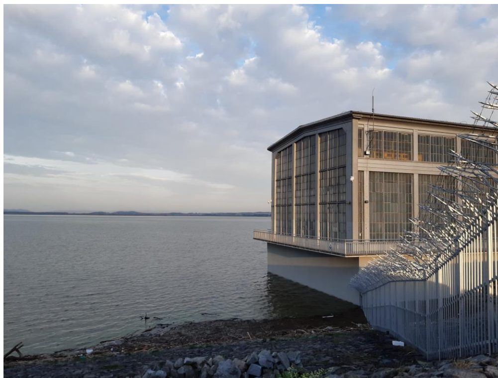
Budynek elektrowni wodnej zbiornika wodnego Otmuchów

Zbiornik to nie tylko blok zrzutowy z elektrownią, ale również przyległa infrastruktura – kanał ulgi wraz z przelewem bocznym w miejscowości Ścibórz oraz dwie przepompownie przy polderze południowym i północnym w miejscowościach Stary Paczków i Pomianów Dolny. Chroni przed powodzią w regionie, produkuje energię elektryczną, zasila w wodę żeglugę, rolnictwo i przemysł, magazynuje wodę oraz pełni funkcję turystyczną i rekreacyjną.