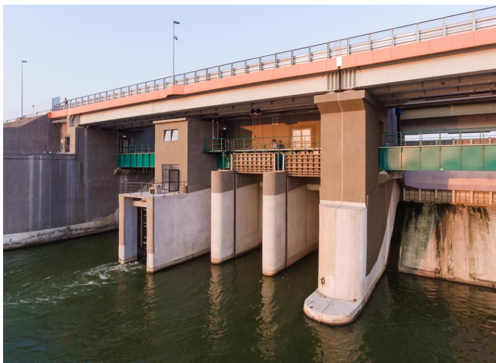
Zapora czołowa zbiornika wodnego Nysa.