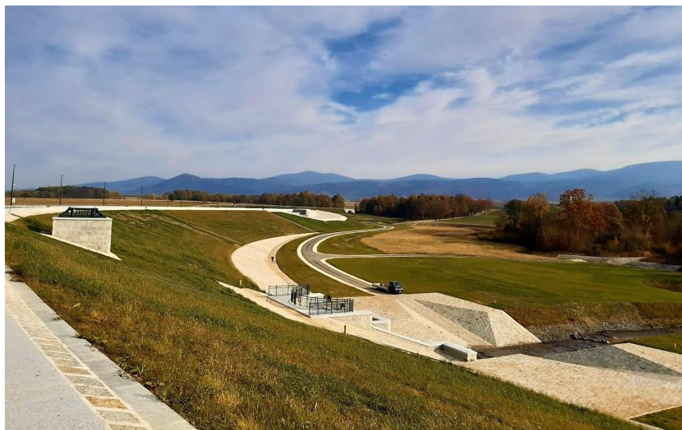
Czasza zbiornika Roztoki.

Budowa zbiornika Roztoki została zrealizowana zgodnie z wszelkimi wymogami środowiskowymi. Ponad 85% czaszy zbiornika jest pozostawiona w stanie naturalnym. Konstrukcja obiektu umożliwia migrację ryb, stworzone zostały granitowe komory dla nietoperzy. Kompensacje przyrodnicze obejmowały nasadzenia ponad 21 tys. drzew iglastych i liściastych, blisko 20 tys. krzewów oraz odnowę siedlisk łągowych i łąkowych.