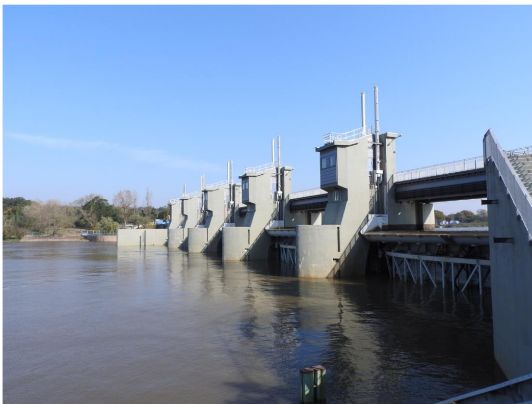
Jaz na stopniu wodnym Brzeg Dolny.

Obiekt składa się między innymi z pięcioprzęsłowego jazu, elektrowni wodnej, produkującej zieloną energię oraz śluzy, której gruntowny remont zakończył się w 2019 roku. Budowla położona jest w zakolu rzeki Odry w taki sposób, że elektrownia wodna i jedno przęsło jazu są zlokalizowane w korycie właściwym Odry. Pozostałe cztery przęsła jazu wybudowano na lewej terasie zalewowej. Śluza dla barek jest położona oddzielnie, za sztucznym wyniesieniem lewej terasy zalewowej tworzącym język rozdzielczy.