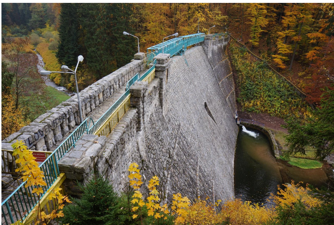
Zapora wodna Międzygórze.

Podstawowe obiekty tworzące ten zbiornik to: imponująca kamienna zapora o długości 110 metrów, urządzenia zrzutowe, przelew powierzchniowy oraz zapora przeciwrumowiskowa. Podczas powodzi tysiąclecia w 1997 roku nadmiar wody nieznacznie przelewał się przez koronę zapory, budowla spełniła jednak swoją funkcję i zahamowała zagrożenie. Potem obiekt był sukcesywnie rewitalizowany, a ostatnie prace modernizacyjne miały miejsce w 2016 roku. Obecnie, oprócz wykorzystywania go do gromadzenia wody w czasie intensywnych opadów deszczu, jest również jedną z turystycznych wizytówek tego regionu Kotliny Kłodzkiej, a przez metalową kładkę zawieszoną na wysokości 30 metrów na koronie zapory wiedzie szlak pieszy w kierunku sanktuarium Maria Śnieżna.