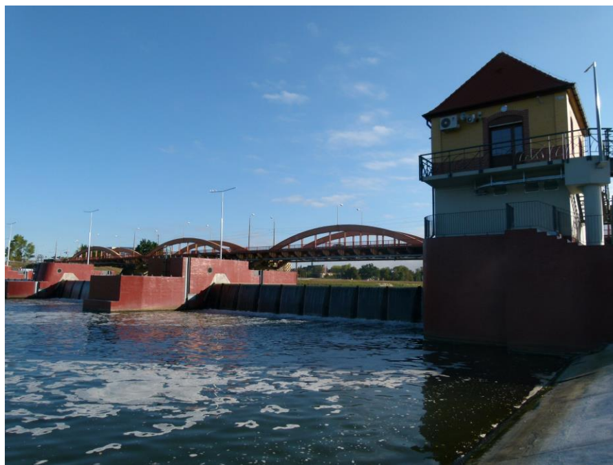
Jaz Różanka i most Trzebnicki.

Szczególą atrakcją dla zwiedzających jest specjalna galeria komunikacyjna, znajdująca się pod taflą wód Odry. To właśnie tym korytarzem, biegnącym po dnie rzeki, nasi pracownicy w bezpieczny i szybki sposób mogą obsługiwać wszystkie elementy składowe obiektu i sprawnie przemieszczać się między jazem, budynkami sterowni, maszynowni i administracyjnymi.