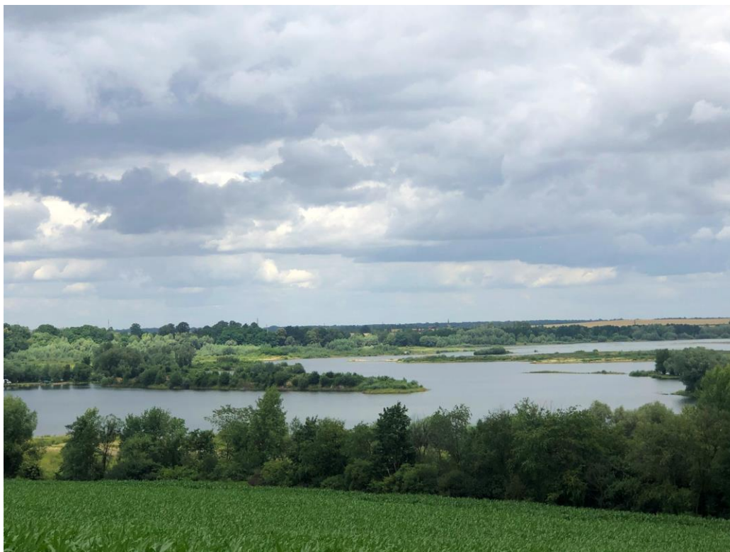
Zbiornik retencyjny Mietków ma pojemność ponad 77 mln metrów sześciennych.

Zalew to kluczowa budowla dla zachodniej części Wrocławia, chroniący ją przed wysoką wodą na rzece Bystrzycy. Jest to również popularna destynacja turystyczna z funkcjonującym kąpieliskiem strzeżonym i wypożyczalnią sprzętu wodnego. Zbiornik pełni także funkcję łowiska pod zarządem PZW. Do ryb zamieszkujących zbiornik należą głównie sandacze oraz leszcze, a także karpie, liny, szczupaki i okonie.