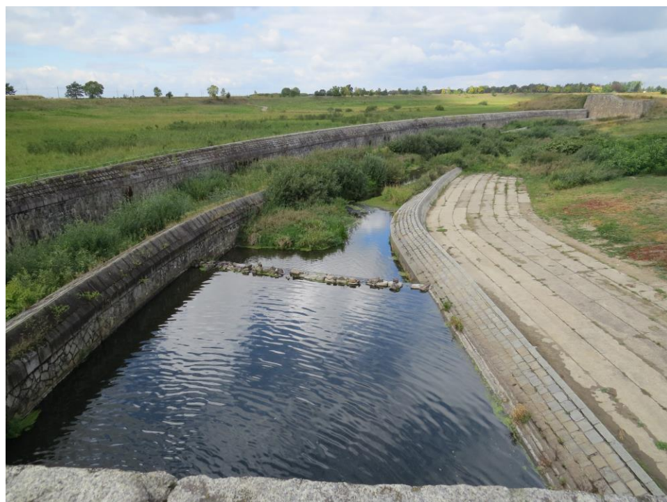
Kanał ulgi służący do bezpiecznego przeprowadzenia wód wezbraniowych.