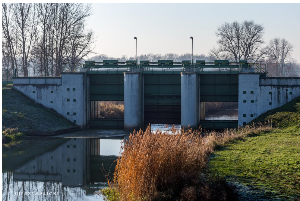
Śluza Sadowa wchodzi w skład przepompowni melioracyjnej.