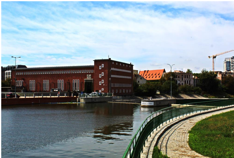
Tuż obok jazu znajduje się budynek Elektrownia Wroclaw I, widoczny po lewej stronie.