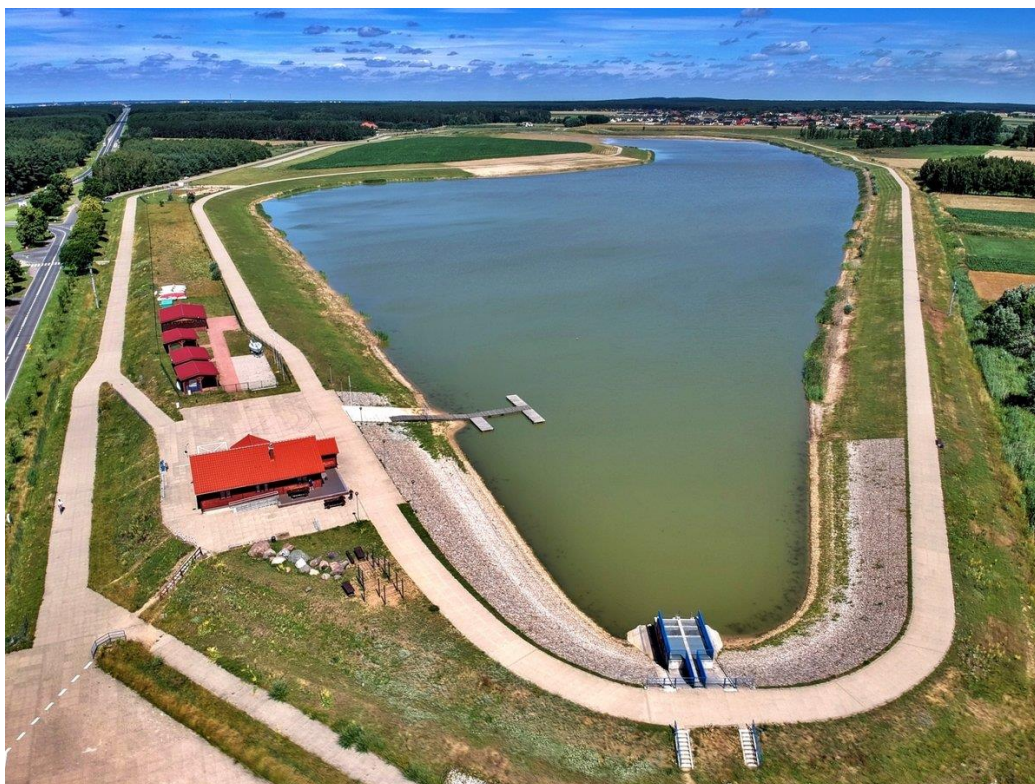
Zbiornik retencyjny Rydzyna.

Zbiornik ma przede wszystkim przeznaczenie retencyjne, a także zabezpiecza okoliczne gospodarstwa i pola przez skutkami powodzi. Ponadto nadano mu funkcję rekreacyjną – zbudowano pomosty, uruchomiono plażę i samoobsługową stację naprawy rowerów.