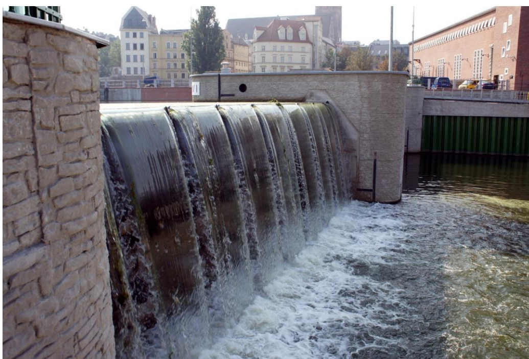
Dwuprzęsłowy jaz Elektrowni Wodnej Wrocław I.

Obecnie, dla potrzeb żeglugi Śródmiejskiego Węzła Wodnego, jaz elektrowni piętrzy także wodę dla żeglugi i przystani jachtowych oraz pasażerskich.