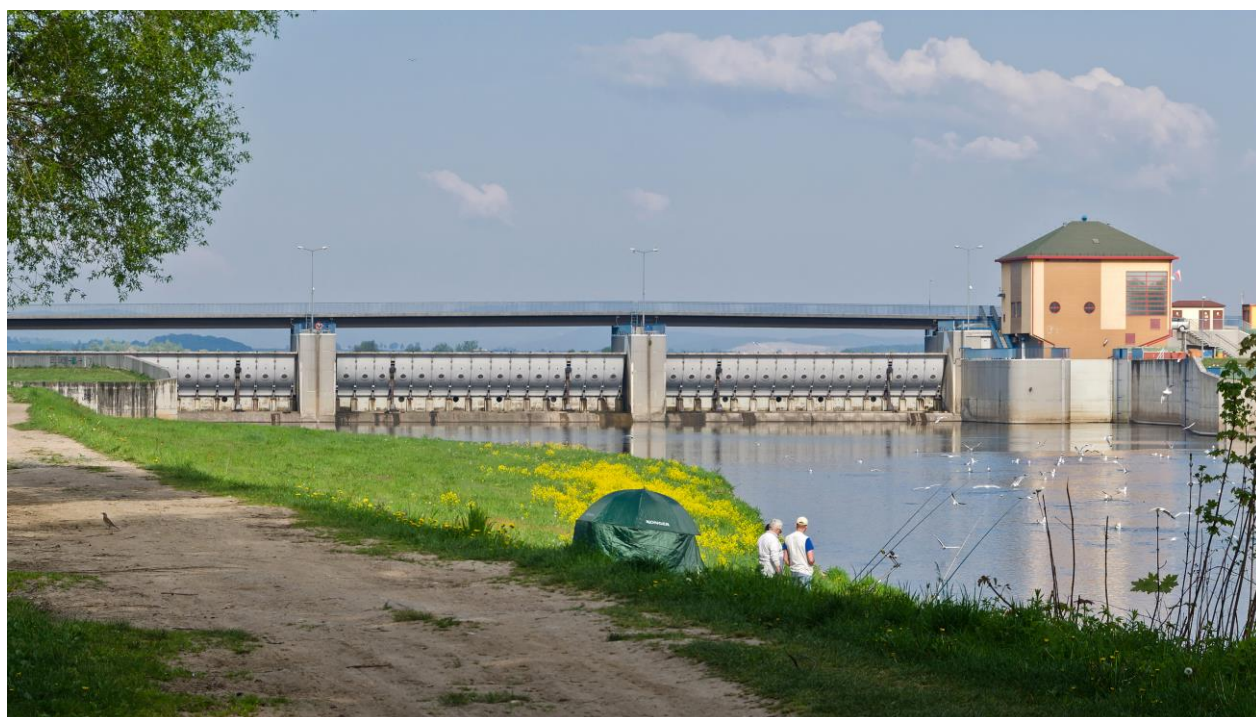
Zapora zbiornika Kozielno.

Obiekt powstał po przegrodzeniu Nysy Kłodzkiej ziemną zaporą o długości 1280 m i 5,7 m wysokości z betonowym jazem. Zbiornik, wraz z położonym bezpośrednio powyżej niego zbiornikiem Topola, tworzy Zalew Paczkowski.