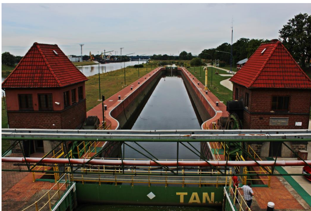
Widok na śluzę Różanka z mostu Osobowickiego.